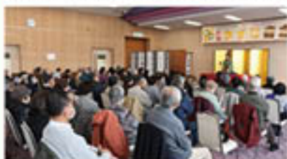
「きずな奇席」で笑顔があふれる

JAで年金をお受け取りいただく年金受給者の会「年金友の会」で開催するスポーツ大会や親睦旅行など、各種イベントにご参加いただくことができます。趣味やお仲間が増えること間違いなしです！