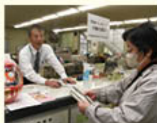
よりそい店にて組合員記念品を贈る

集約後の拠点は「よりそい店」として、遠隔相談システムRTSによる一部手続きや相談対応、硬貨機能付きATMの設置、また、職員2人の配置による組合員サービスの提供など、「組合員とJAをつなぐ拠点」として、引き続き運営してまいります。