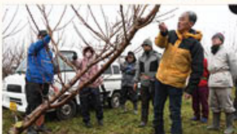
せん定しながら考え方を共有