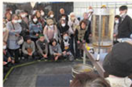
はちみつ工房ではちみつ採取方法を見学

旅先は東京都と千葉県。東京湾上から都内の景色を楽しめる「シンフォニークルーズ」で豪華ランチを満喫したほか、はちみつ工房などでの買い物を楽しみました。部員の一人は、「久しぶりにお会いする方もいて話が弾んだ」と笑顔。別の部員は「日常生活を飛び出して、なかなか行くことができない場所に連れて行ってもらえてとても楽しかった」と感想を寄せました。