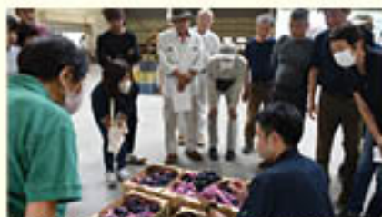
検査基準を意識した「ぶどう」の男づくり購買会