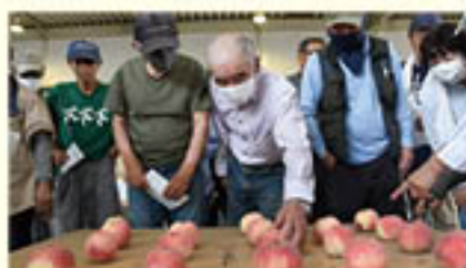
品質統一へ結集した「もも」購買会

また、「シャインマスカット」人気により需要が伸びる「ぶどう」は、生産者・生産量の増加により、過去10年で最高の販売金額の確保に期待がかかっています。