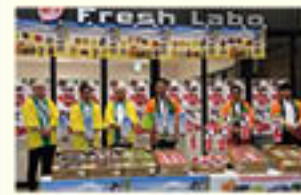
JA中野市と東京の市場でPR

ました。大阪府では初開催、また、東京都では初めてJA中野市とトップセールスを合同で行い、役員がJA農産物を売り込みました。