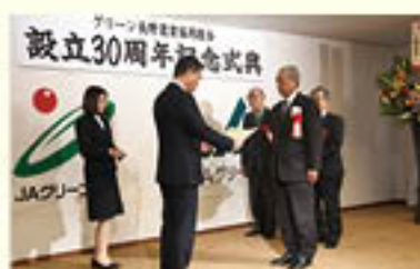
JA運動に長年協力をいただいた組合員を表彰