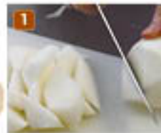
1 大根は皮をむいて一口大の乱切りにする。