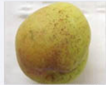
実に発生したかいよう病の病斑

主にあんずの果実、枝、葉、花に発病する。 葉への発病は発芽直後から見え始め、水浸状に赤褐色から黒褐色の斑点となり、ひどくなると中心に穴があく。 果実の病斑は、周縁部が赤紫色の小さな病斑と、黒色の水浸状で直径2ミリから10ミリ程度のへこんだ病斑の2種類を生じる。