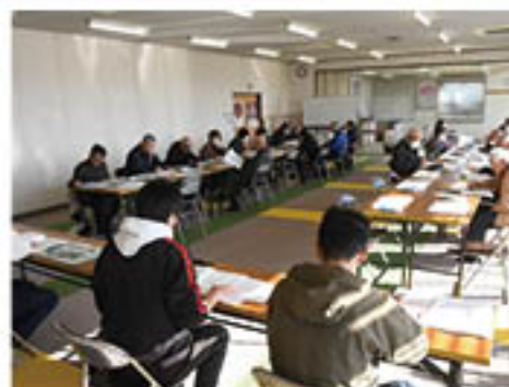
農業振興計画について説明する会場

営農販売部は12月9日から23日まで91会場で「営農懇談会」を開きました。生産者・組合員に対し、令和7年度から9年度の農業振興方針を盛り込む「JA中期農業振興計画」をはじめ、次年度の各種補助施策、肥料・農薬・果実袋の「年間特別予約」の変更点などについてを営農技術員が説明。組合員から計画への意見・要望を求めるとともに、年間特別予約の利用や農業振興に向けたJAへの結集を呼びかけました。JAでは組合員の声について、計画に反映させるとともに、変更・改善点について再検討しながらJA中期農業振興計画とJA中期3ヵ年計画を樹立し、農業振興と生産者支援につなげる考えです。