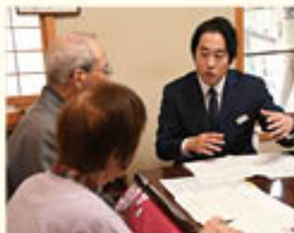
安心をお届けするLA

共済事業では、組合員・利用者さまの元へ訪問し、ニーズやライフスタイルの変化に応じた「保障」をご提案するライフアドバイザー(LA)の拠点について、新たに共済普及センター(共和・青木島・真島)を設置しました。これにより、LA間の情報連携等、業務効率を高め、普及活動を通じて組合員のみならず安心をお届けしています。