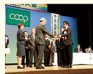
代表で表彰状を受け取る青壮年部部長

青壮年部は、11月7日に松本市で行われた「第73回JA長野県大会」において、「積極的な組織活動が、JAの発展に貢献してきた」として、「令和6年度優良組合員表彰」を受賞しました。