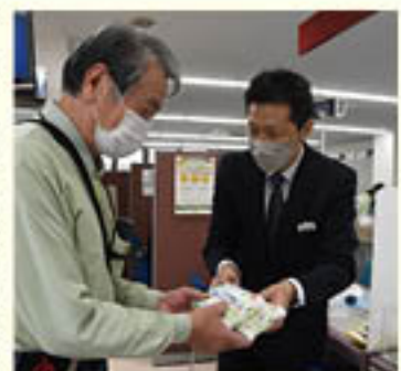
ご利用に感謝をお伝えする職員

年金受給者を対象に「年金感謝デー」を、2ヵ月に一度の年金支給日に合わせて4月より初開催しました。予め対象者に引換券を郵送し、券をお持ちいただくことでプレゼントと交換するもの。職員が感謝をお伝えしながらお渡ししました。