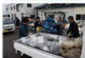
廃プラスチックを回収

各会場では、生産者が持ち込んだ廃棄物の重量をJA職員や回収業者が計測。廃プラスチックを15.9トン、不要農薬を2.6トン回収し、業者へと引き渡しました。