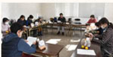
座学で土づくりの情報共有