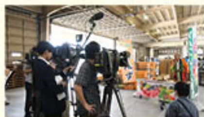
マスクミに向けて「あんず」をPR