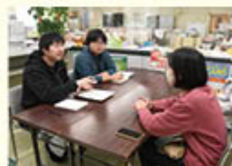
相い手の相談に営農技術員が対応

JAでは、販売を目的に農業を営む組合員・生産者に対し、より具体的な相談対応を行うことを目的に11月29日、「グリーン営農相談センター」を開設しました。センターは特定の拠点を持たず、よりそい店や支所などで「個別相談会」を開催。相談者の課題に対し、JAや行政等の担当者が具体的な相談に応じ、課題の解決やスムーズな就業などを支援する考えです。初回は6組の生産者・就農希望者が相談に訪れました。