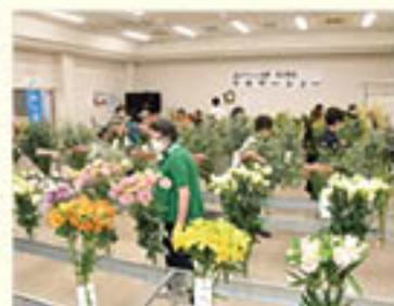
多くの来場者が訪れた会場

花き部では、部会員が栽培・出品した花きを展示する「フラワーショー」を、篠ノ井の営農センター2階で開催しました。同会場での開催は11年ぶり。会場には、部会員渾身の花き106点が展示され、来場者を魅了しました。また、出品物の品評会も行い、生産者の生産意欲向上につながりました。