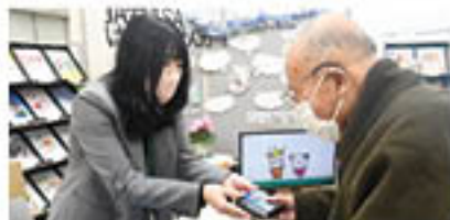
年金感謝デーでプレゼント

JAで年金をお受け取りの方へ、年金支給月に合わせて支所・よりそい店窓口にお越しただくと、日用品等をプレゼントいたします。プレゼントのお引き換えに必要となる引換券は3月頃、6回分まとめて郵送ハガキにて対象の方に送付しております。