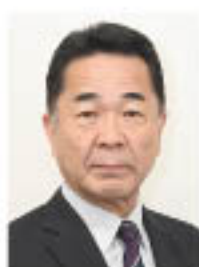
グリーン長野農業協同組合