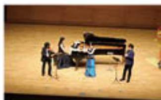
温かな音楽を奏でる出演者

JA虹のホールは11月20日、若里のホクト文化ホールを会場に、「2024虹の花束コンサート」を開きました。「ご遺族の心に寄り添う時間の提供」を目的に、昨年度4月から3月の間の同ホール利用者を対象に招待。当JA管内から188人が来場し、演奏家4人が奏でるクラシックの調べに心をゆだねていました。