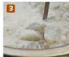
2 材料の表面が水面から出る出ないか程度の水(=ひたひた)を入れる。