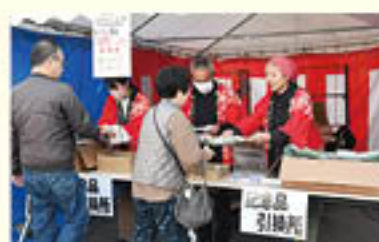
JA 寮や支所・よりそい店にて「組合員記念品」を贈呈

令和5年度に引き続き、令和6年も、当JA設立30周年記念事業を行いました。イベントやサービスの提供を通じ、組合員・地域のみなさまのご利用と協力に感謝をお伝えしました。