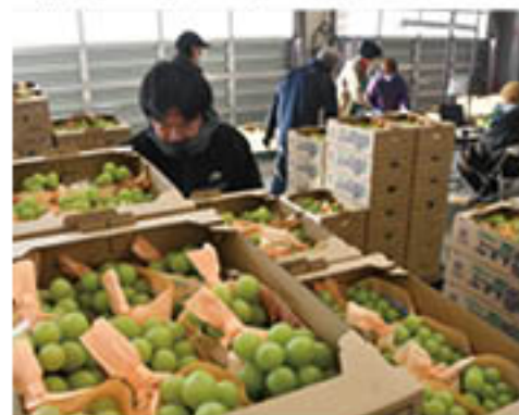
検品・出荷準備がすすむセンター

JAでは引き続き、ぶどう部会員に対し、冷蔵シャインマスカットの取り組み提案を積極的に行うとともに、「クイーンルージュ®」の冷蔵対応も推進し、両品種の併売による販売単価と生産者手取りの向上につなげる考えです。