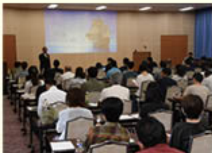
資産形成・運用セミナーを開催

金融事業では、組合員・利用者の「資産を守る」とともに「増やす」ために、金融営業担当職員を中心に、組合員の要望に沿った資産形成・運用サポートに取り組みました。この一環で「資産形成・運用セミナー」を開き、出席者は投資への心構えや、関心の高まる「新NISA制度」などについて、学びを深めました。