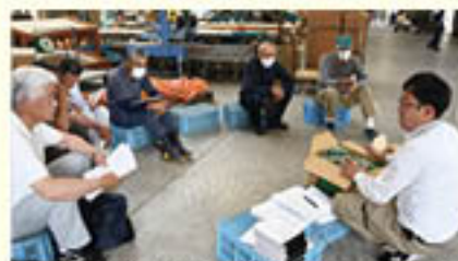
出荷者・出荷調整・販売金額が伸びた「ピーマン」の購買会