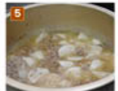
3 大根が汁から顔を出す位になるまで煮詰める。