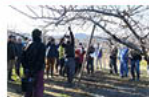
営農技術員の実演でポイントを確認

生産部会とグリーン農業講座、果樹セミナーでは12月中、果樹の「せん定」の講習会を開きました。せん定は次年度生産に向けた重要な作業。生産者は、営農技術員の実演を通じ、ポイントを確認していました。